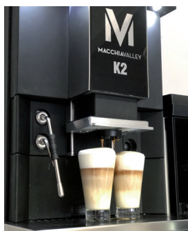
2 Latte Macch. 35 sek.