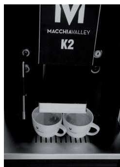
2 Kaffee in 25 sek.